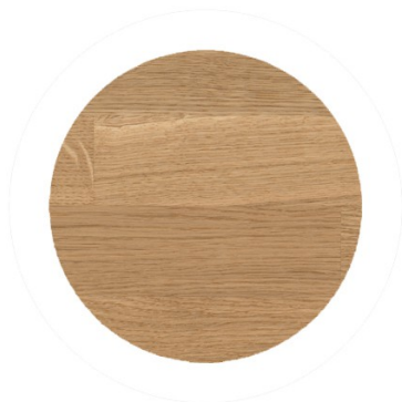
3058 bezbarwny mat