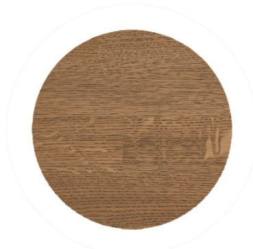
3061 akacja mat